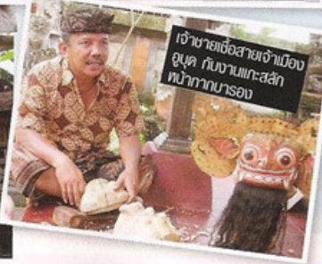
เจ้าชายเชื้อสายเจ้าเมืองอุบุด กับงานแกะสลัก หน้ากากบารอง