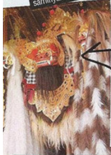
หน้ากากและชุดบารองเต็มยศ

ในตลาดโลกประมาณ 600 ดอลลาร์ต่อปอนด์ ราคาหน้าสวนที่บาหลี แก้วละ 10 ดอลลาร์ ครั้งก็แพงกว่าบาท!! แล้วเกี่ยวข้องกับชะมดยังไงหรือ? ตรงตัวเลยล่ะคุณขา "กาแฟ..ชะมด" ไม่ต้องแปลเลย กาแฟนี้มีเฉพาะแถบเกาะสุมาตรา ชาวสุมาตราจะเรียกกันว่า "Kopi Luwak" kopi โกปี ภาษาอินโด คือกาแฟ Luwak ลูวัก ก็คือชะมด เป็นกาแฟที่มีขั้นตอนการผลิตที่เรีตมาก ธรรมชาติล้วนๆ..เริ่มจากชะมดที่อยู่ในสวนกาแฟ หากกินแบบบุฟเฟ่ต์ที่เราเชื่อมือได้ว่ามันจะเลือกสิ่งที่ดีที่สุดเสมอ เพราะฉะนั้น