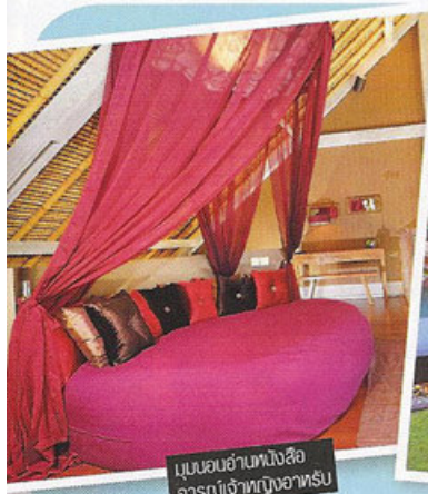
มูนนอนฮ่านพั่งฮือ อ่าร์เบ้เจ้าทงอฮ่าร์

แต่ - Kopi luwak ไย้หือของ animalcoffee เคยใส่ในถุงของขวัญไท้เซเลนในงาน เอมนี้ อะเวอร์ด ปี 2006 • Kopi luwak ยังเป็นกาแฟที่โอบราห์ วันเฟรีย พูตทั้งในรายการของเรอด้วย