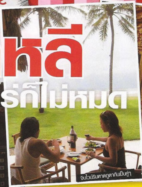
จับไว้นรินทาคุดทานเป็นสุ้า