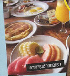
อาหารเช้าของเรอ