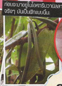
ก่อนจะมายี้ไปเออกริบว่ามิลลา อธิงๆ มันเป็นฮิกแบบนั้นะ