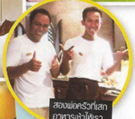
สองพ่อครว้ที่เสก อาหารเข้าให้เรอ