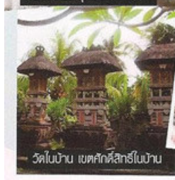
วัดโบราณ เขตศักดิ์สิทธิ์ในบา