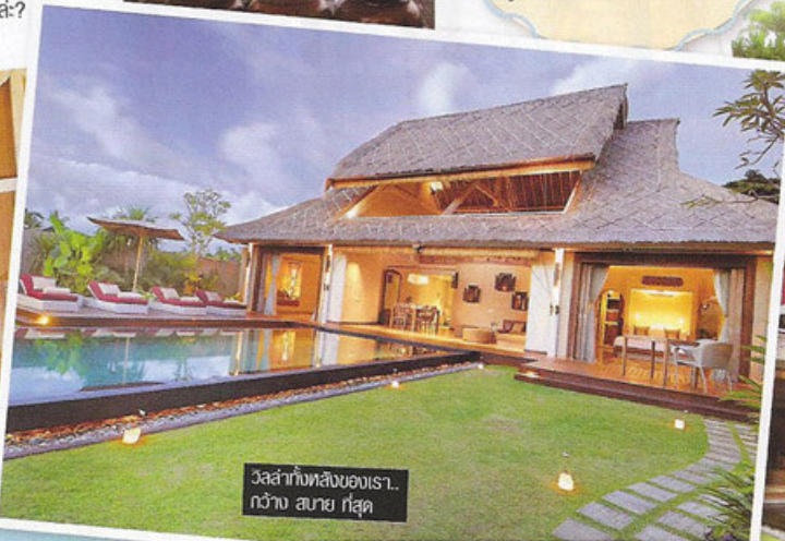
วิลล่าทงหลังของเร.. กว้าง สบาย ทั้สุด