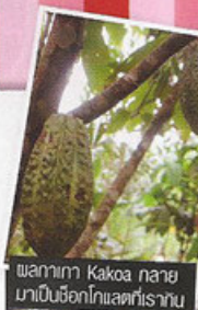
ผลากากา Kakaอ กลาย มาเป็นช็อกโกแลตที่ร้านน

และเหตุผลของราคาแพง..เอ้อ!คุณคิดว่าชะมดหนึ่งตัว จะยี้ได้วันละเท่าไรล่ะ? ยังไม่จับที่ไปเออฮี้ก็โหนดตามเก็บไม่ เจออีกล่ะ กาแฟชะมดเลยเข้าข่ายเป็นของหายากไป ไป ทั้งที่ต้องไม่แพงด่า ซอซิม..ซิมเสร็จแล้ว เจ้าของสวนบอก ว่า..”ฮืออย่างหนึ่งที่มันแพงเพราะ มันเป็นไวอากร้าน้อยๆ ใต้ด้วย”.....เฮาส์! บกตอนชิมไปแล้ว..ทำไงล่ะ?