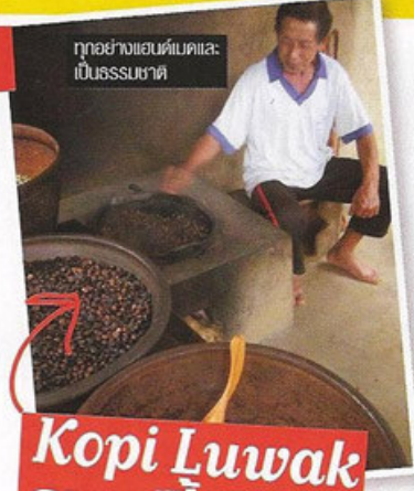
ทุกอย่างอันแดบแตและ เป็นธรรมชาติ

ระบำบารอง (Barong Dance) ระบำท้องถิ่นบาหลี แยกไปครมมาต้องได้ดู เป็นความเชื่อของอินดูที่มีบารอง สัตว์ที่เหมือนเสือหรือสิงโตนี้ล่ะ เป็นตัวแทนของความดีต่อสู้กับความชั่วร้าย คนที่แสดงเป็นบารองจะคลุมชุดเป็นขนและสวมหน้ากาก ซึ่งแกะสลักจากไม้ และมีส่วนคนเท่านั้นที่แกะได้ เพราะมีชื่อเสียงศักดิ์สิทธิ์ สืบทอดกันมาเป็นตระกูล อย่างที่อุบุด คนที่แกะก็คือ ลูกหลานเจ้าเมืองอุบุด ถ้าปกครองแบบดั้งเดิม เขาก็คือเจ้าชายเลยล่ะ (เวลาเรียกเขา เราเรียกว่า prince ปะ) และจะแกะสลักได้ไม่เข็ดขูดของบ้านเท่านั้น เพราะถือว่าเป็นเขตศักดิ์สิทธิ์ ก่อนที่เราจะเข้าไปต้องมีพาคาดแอกก่อน เป็นสัญลักษณ์ของความเป็นคนดี ดีพอที่จะเข้าพื้นที่ศักดิ์สิทธิ์ได้...แต่ถ้าสาวใดกำลังอยู่ในช่วงวันแดงเดือด เสียใจจริงๆ จะรัก...ต้องหยุดรอข้างนอกเขตนี้จนแดงห้ามเข้า! ส่งใจเข้าไปแทนแล้วกัน