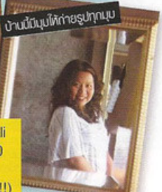
บ้านนี้มูนบ่ที่ท้อฮู่ทุกมูน

สำหรับคนอ่านคสิโอ space@bali ใจดีให้ราคาเป็นพิเศษ คินละ: 350 เทรียญคอรลาร์เท่านั้น!! รวม อาหารเช้า 4 ที่ (อย่าสิมทาร์ 6!!)