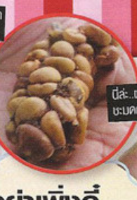
นี่ละ..ผลงานของ ชะมดก่อนคว่ำ!