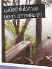
มันถึงพริกไปรกาแฟ บนเขา..อากาศดีมาก!